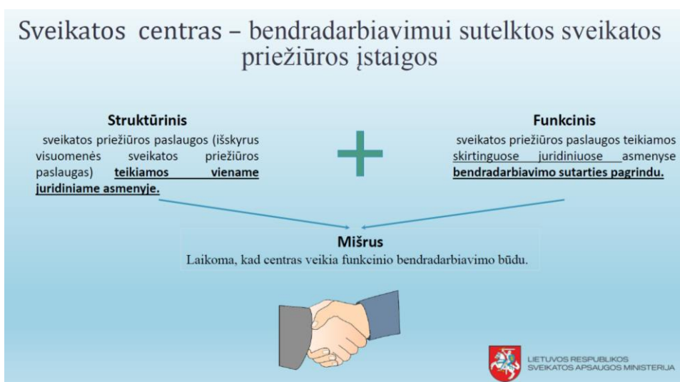
1 pav. Sveikatos centro veikimo modelis. Informacijos šaltinis: LR SAM.

Sveikatos centras - asmens sveikatos priežiūros įstaigos (atskiri juridiniai asmenys) (toliau – ASPĮ) bendradarbiaudamos tarpusavyje susijungusios į asmens sveikatos priežiūros įstaigų tinklą ir užtikrinančios būtinų savivaldybės sveikatos centro paslaugų teikimą (1 pav.).