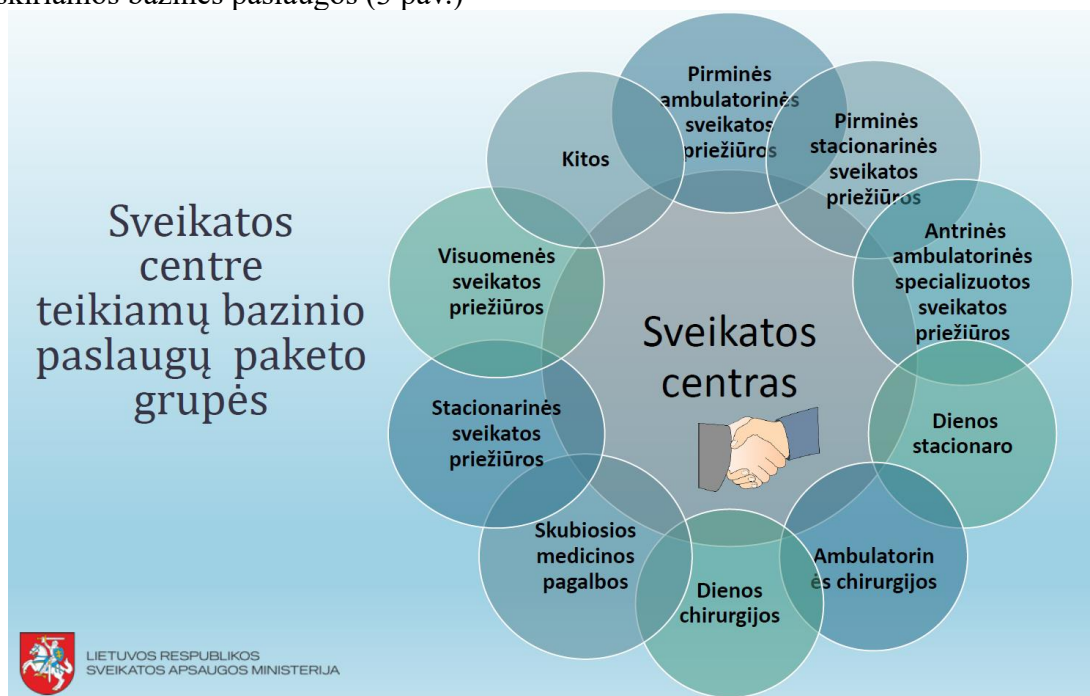
3.pav. Sveikatos centro teikiamų bazinių paslaugų grupės. Informacijos šaltinis: LR SAM.

Sveikatos centro teikiamos LR sveikatos apsaugos ministro 2023 m. gegužės 22 d. įsakyme Nr. V-589 „Dėl Sveikatos centrui priskiriamų sveikatos priežiūros paslaugų teikimo organizavimo tvarkos aprašo patvirtinimo“ (toliau – Įsakymas) nurodytos Sveikatos centrui priskiriamos bazinės paslaugos (3 pav.)