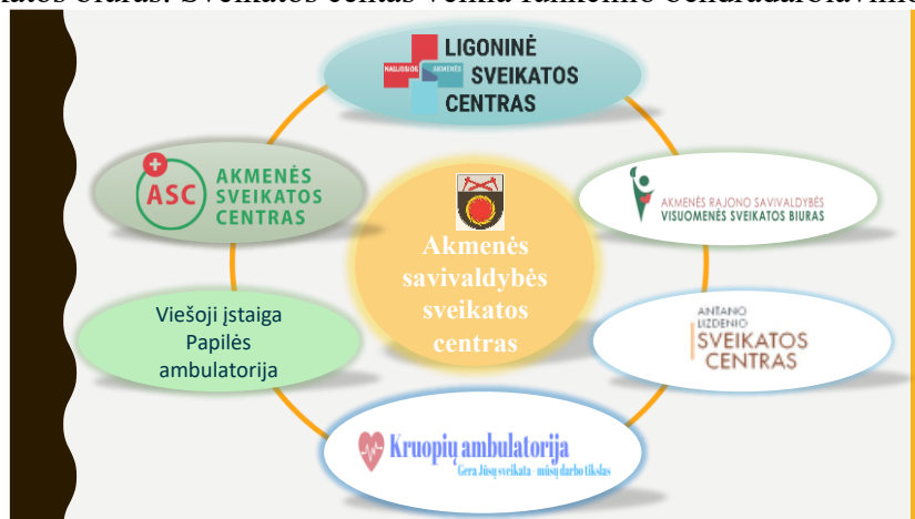
2 pav. Sveikatos centro veikimo būdas.

Sveikatos centras įsteigtas remiantis Akmenės rajono savivaldybės tarybos 2023 m. spalio 20 d. sprendimu Nr. T-273 „Dėl Akmenės savivaldybės sveikatos centro steigimo“, Struktūriniu būdu, prie VšĮ Naujosios Akmenės ligoninės prijungus VšĮ Akmenės rajono pirminės sveikatos priežiūros centrą ir pakeitus įstaigos pavadinimą į VšĮ Naujosios Akmenės ligoninės-sveikatos centras ir Funkcinio bendradarbiavimo būdu, kuriame bendradarbiavimo sutarties pagrindu su Sveikatos centru, kai Sveikatos centrui priskirtos paslaugos teikiamos atskiruose juridiniuose asmenyse, dalyvauja šios įstaigos: VšĮ Kruopių ambulatorija, VšĮ Papilės ambulatorija, UAB Akmenės sveikatos centras, UAB Antano Lizdenio sveikatos centras, Akmenės rajono savivaldybės visuomenės sveikatos biuras. Sveikatos centas veikia funkcinio bendradarbiavimo būdu (2 pav.).